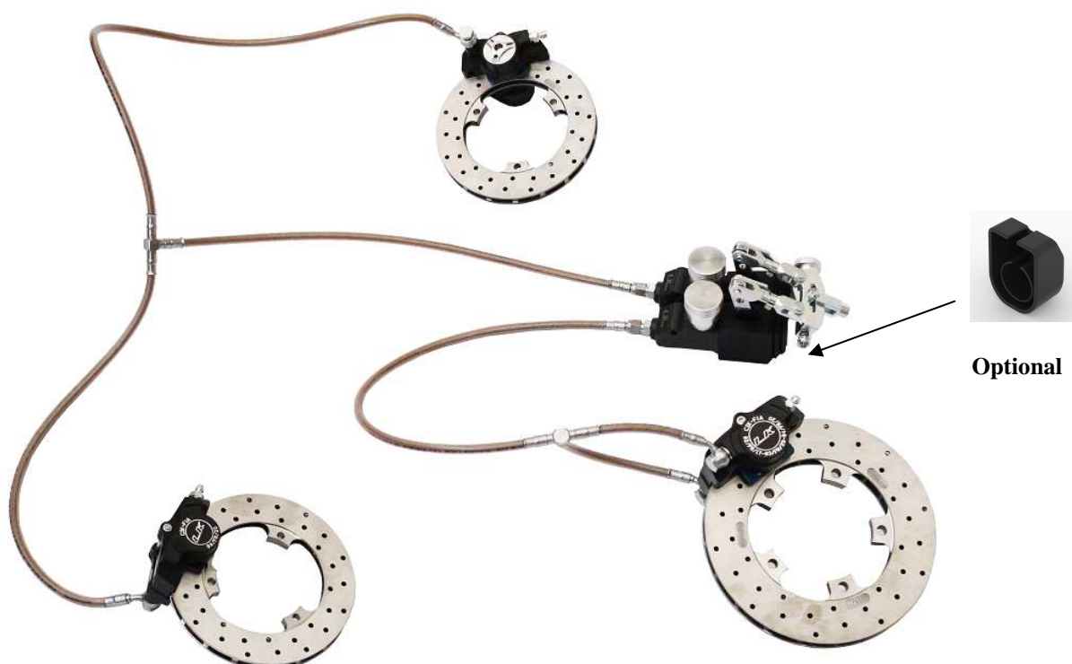
PHOTO VUE DE DESSUS DU SYSTÈME COMPLET ASSEMBLÉ

This Homologation Form reproduces descriptions, illustrations and dimensions of the brake system at the moment of the CIK-FIA homologation. The Manufacturer may modify them, but only within the limits set by the CIK-FIA Regulations in force.