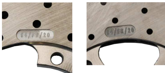
Disques / Discs