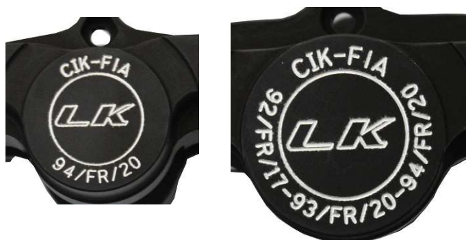
Etriers / Calipers