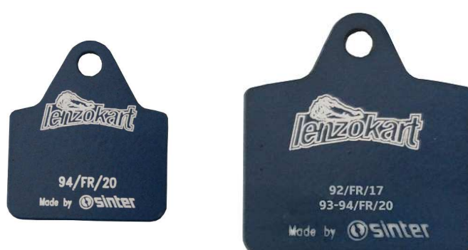
Plaquettes / Pads