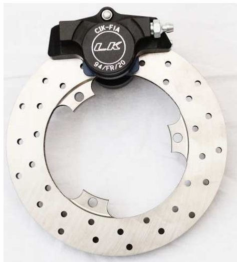
Photo du frein arrière : étrier(s) et disque(s) seulement Photo of rear brake: caliper(s) and disc(s) only

Photo du frein avant : étriers et disques seulement Photo of front brake: calipers and discs only