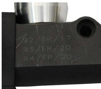
Maître-cylindre / Master-cylinder