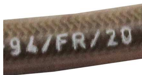
Tuyaux / Lines