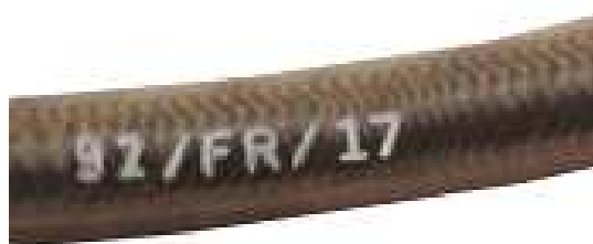
Tuyaux / Lines