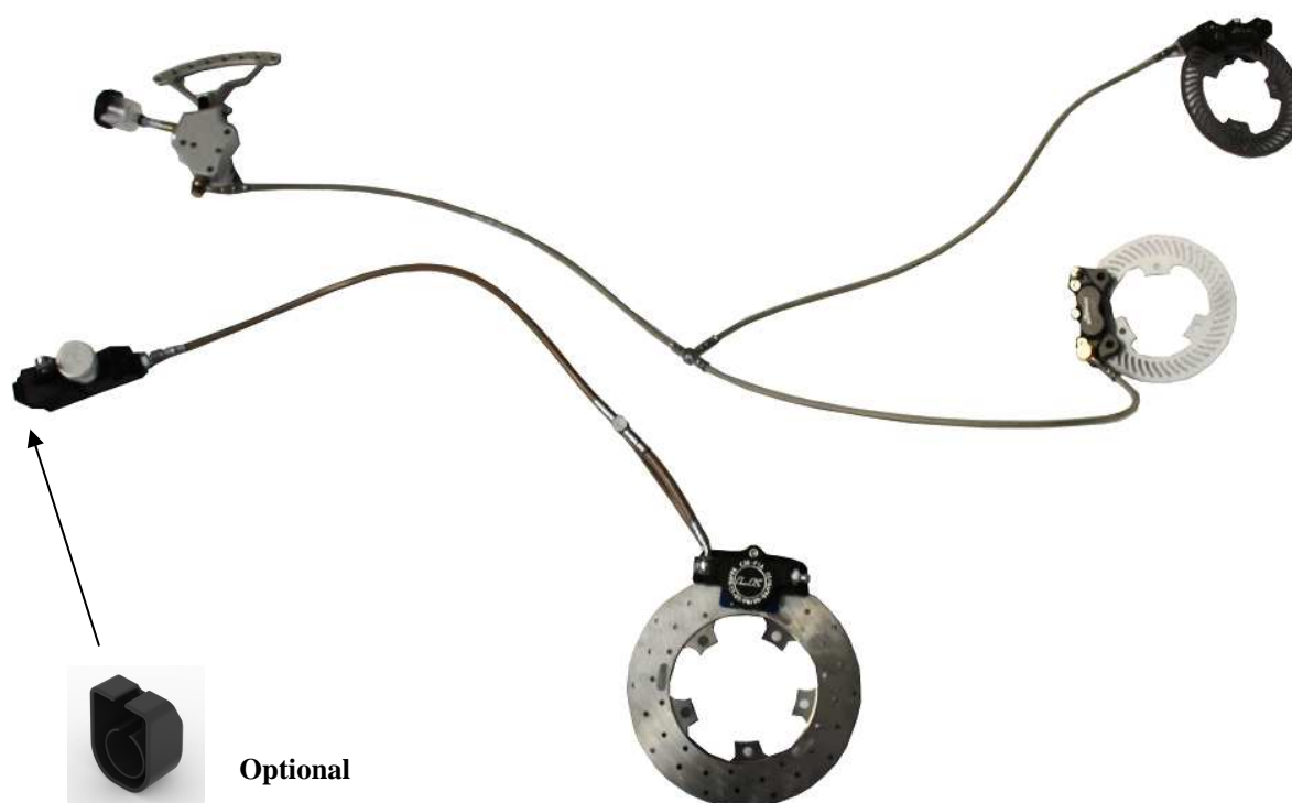
PHOTO VUE DE DESSUS DU SYSTÈME COMPLET ASSEMBLÉ

This Homologation Form reproduces descriptions, illustrations and dimensions of the brake system at the moment of the CIK-FIA homologation. The Manufacturer may modify them, but only within the limits set by the CIK-FIA Regulations in force.