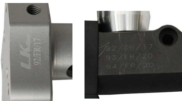
Maître-cylindre / Master-cylinder