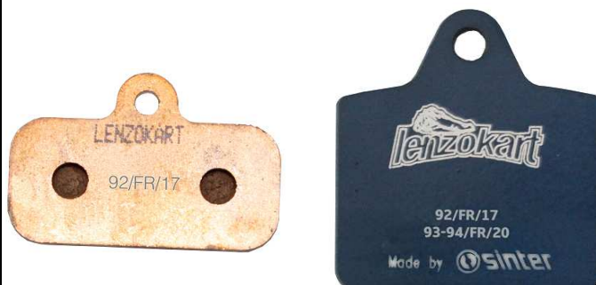
Plaquettes / Pads