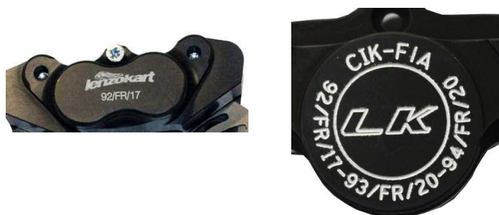
Etriers / Calipers