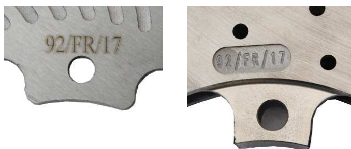
Disques / Discs