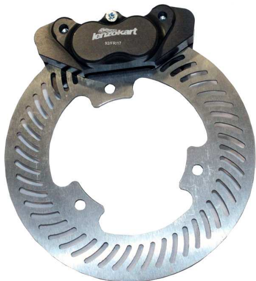
Photo du frein avant : étriers et disques seulement Photo of front brake: calipers and discs only