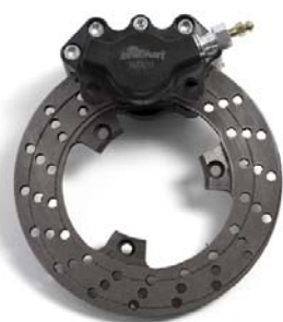
Photo du frein avant : étriers et disques seulement Photo of front brake: calipers and discs only