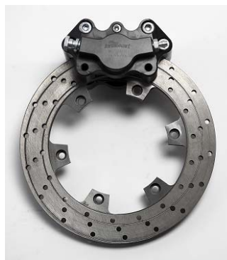
Photo du frein arrière : étrier(s) et disque(s) seulement Photo of rear brake: caliper(s) and disc(s) only