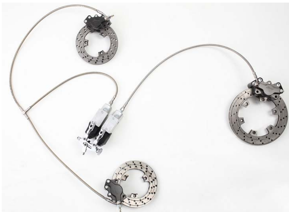
PHOTO VUE DE DESSUS DU SYSTÈME COMPLET ASSEMBLÉ

This Homologation Form reproduces descriptions, illustrations and dimensions of the brake system at the moment of the CIK-FIA homologation. The Manufacturer may modify them, but only within the limits set by the CIK-FIA Regulations in force.