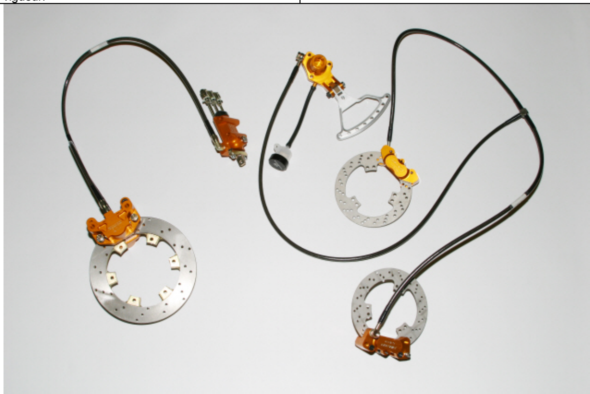
PHOTO VUE DE DESSUS DU SYSTÈME COMPLET PHOTO FROM ABOVE OF COMPLETE SYSTEM

This Homologation Form reproduces descriptions, illustrations and dimensions of the brake system at the moment of the CIK-FIA homologation. The Manufacturer may modify them, but only within the limits set by the CIK-FIA Regulations in force.