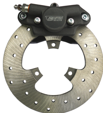
Photo du frein avant : étriers et disques seulement Photo of front brake: calipers and discs only