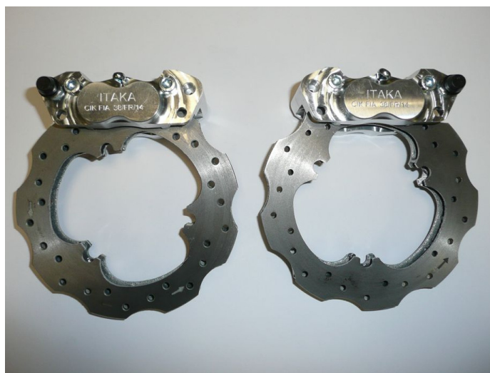
Photo du frein arrière : étrier(s) et disque(s) seulement Photo of rear brake: caliper(s) and disc(s) only