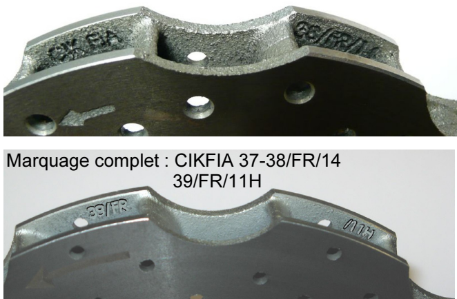
Disques / Discs