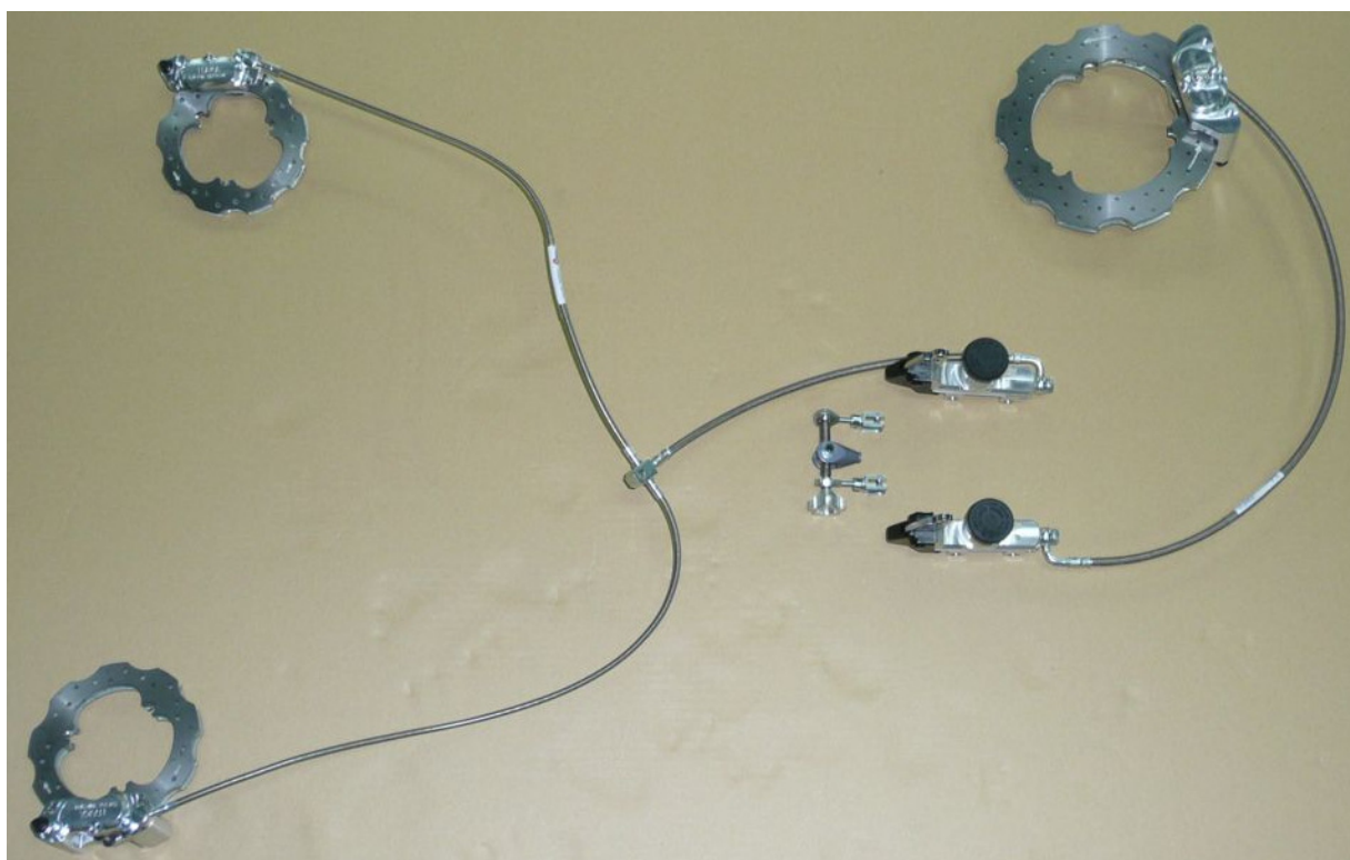
PHOTO VUE DE DESSUS DU SYSTÈME COMPLET ASSEMBLÉ PHOTO FROM ABOVE OF COMPLETE ASSEMBLED SYSTEM

This Homologation Form reproduces descriptions, illustrations and dimensions of the brake system at the moment of the CIK-FIA homologation. The Manufacturer may modify them, but only within the limits set by the CIK-FIA Regulations in force.