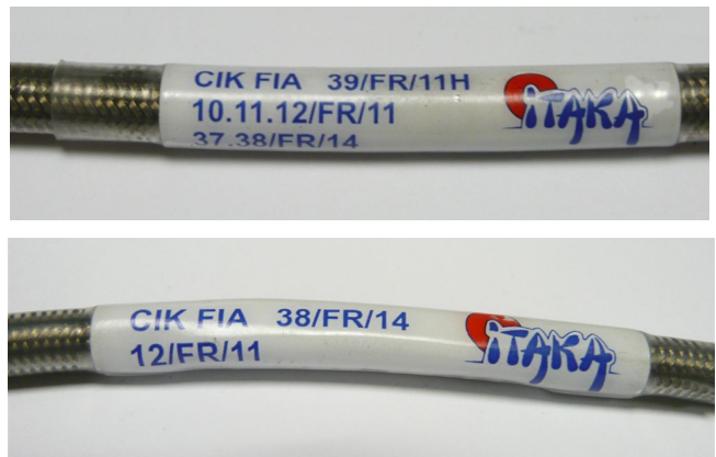
Tuyaux / Lines