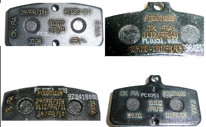
Plaquettes / Pads