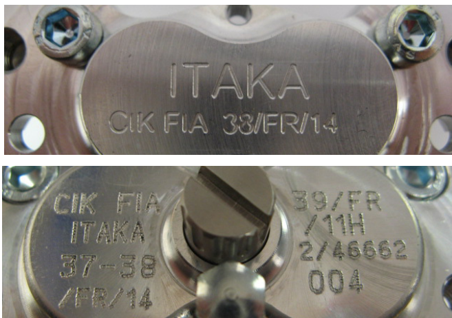
Etriers / Calipers