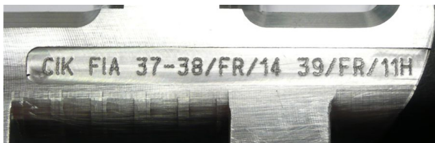
Maitre-cylindre / Master-cylinder