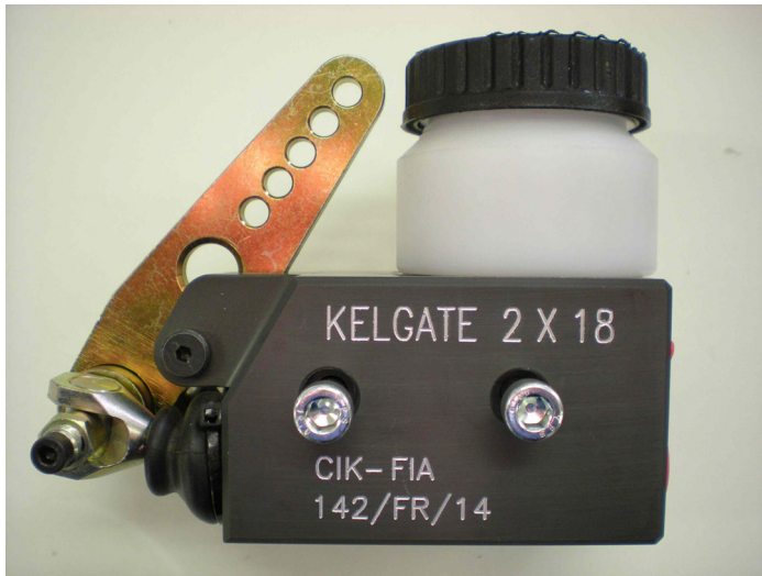
Maître-cylindre / Master-cylinder