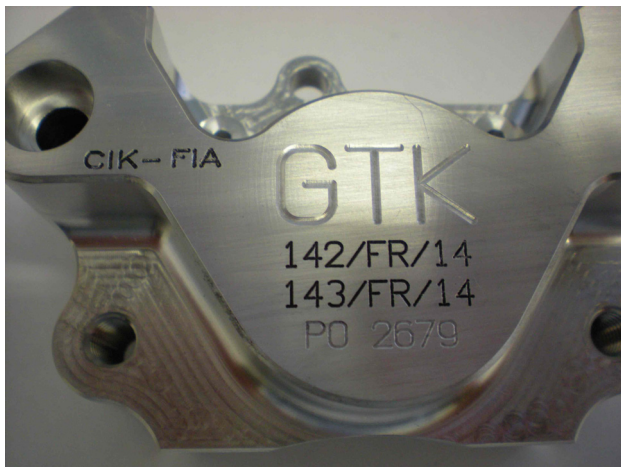
Etriers / Calipers