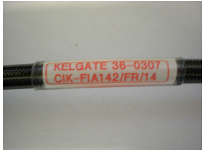
Tuyaux / Lines