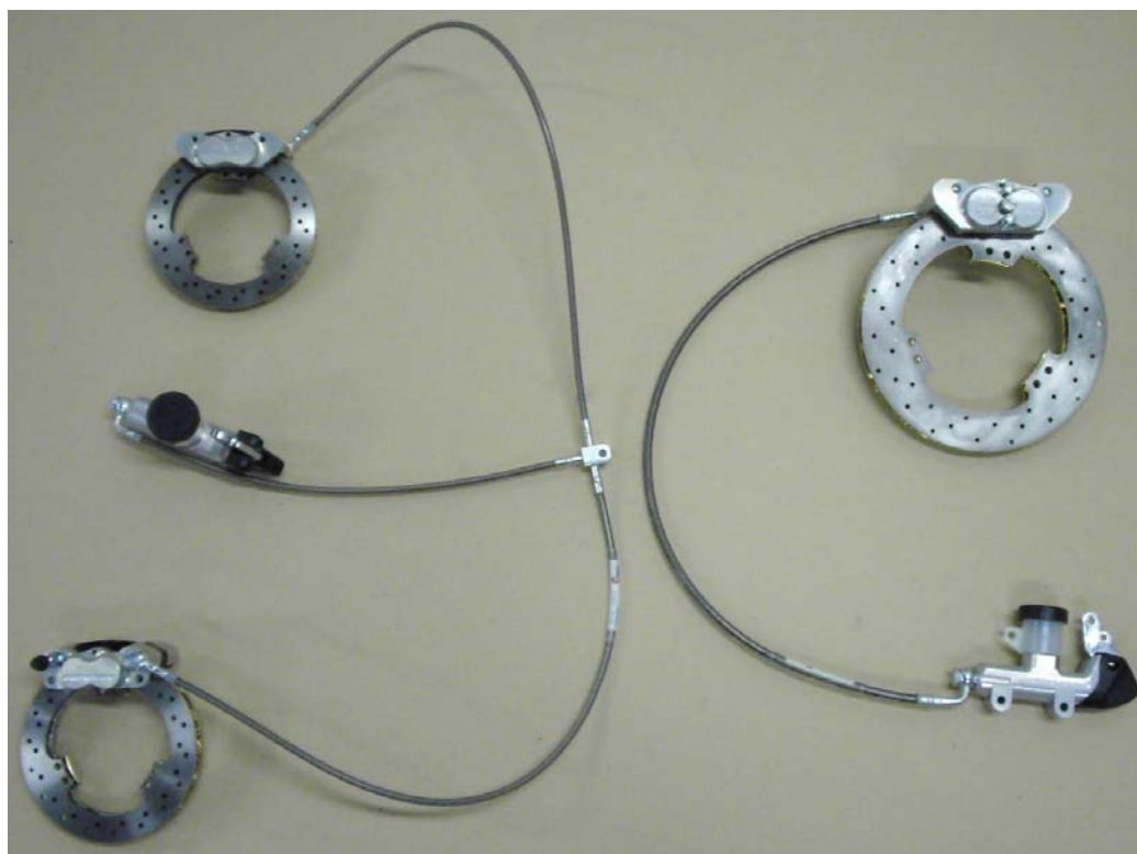
PHOTO VUE DE DESSUS DU SYSTÈME COMPLET PHOTO FROM ABOVE OF COMPLETE SYSTEM

This Homologation Form reproduces descriptions, illustrations and dimensions of the brake system at the moment of the CIK-FIA homologation. The Manufacturer may modify them, but only within the limits set by the CIK-FIA Regulations in force.