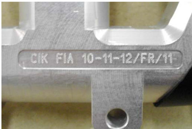
Maitre-cylindre / Master-cylinder