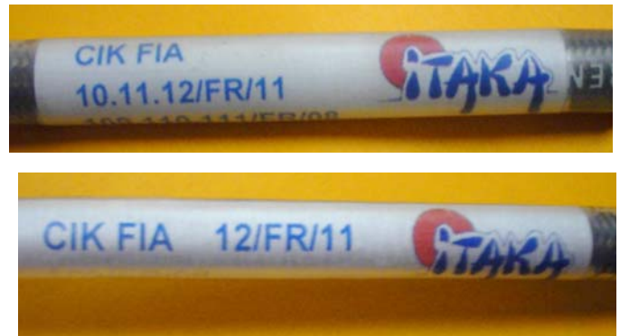
Tuyaux / Lines