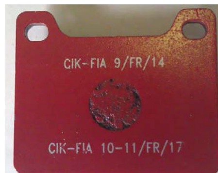
Plaquettes / Pads