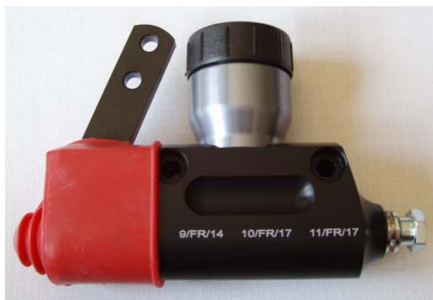
Maître-cylindre / Master-cylinder