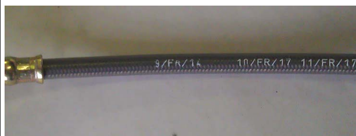
Tuyaux / Lines