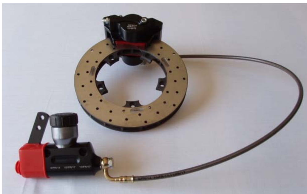
PHOTO VUE DE DESSUS DU SYSTÈME COMPLET ASSEMBLÉ

This Homologation Form reproduces descriptions, illustrations and dimensions of the brake system at the moment of the CIK-FIA homologation. The Manufacturer may modify them, but only within the limits set by the CIK-FIA Regulations in force.