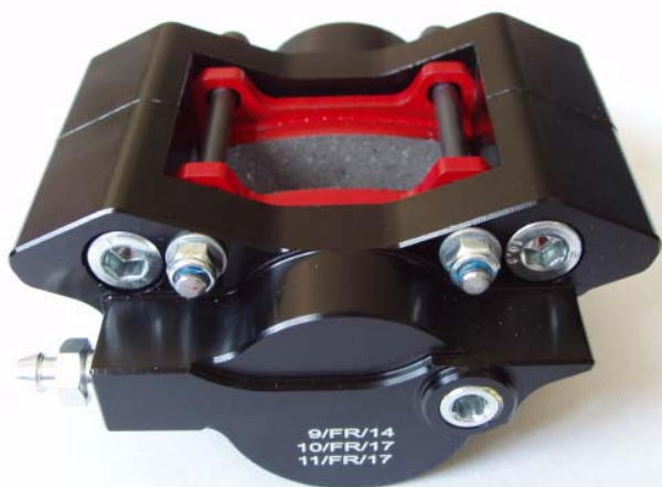
Etriers / Calipers