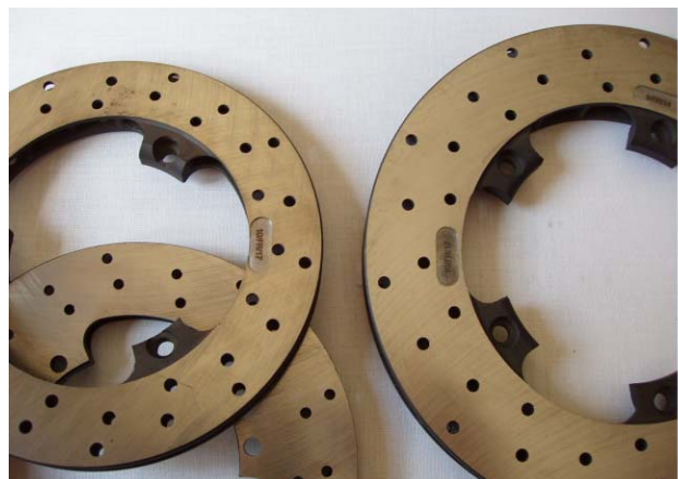
Disques / Discs