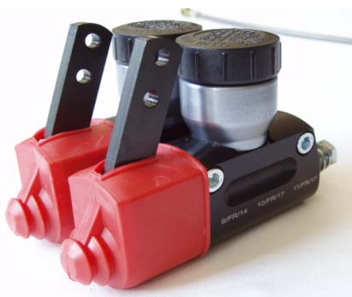
Maître-cylindre / Master-cylinder