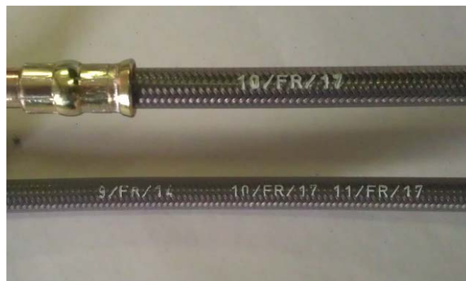
Tuyaux / Lines