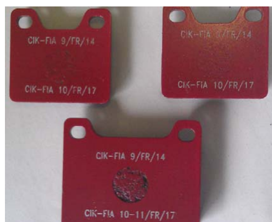
Plaquettes / Pads