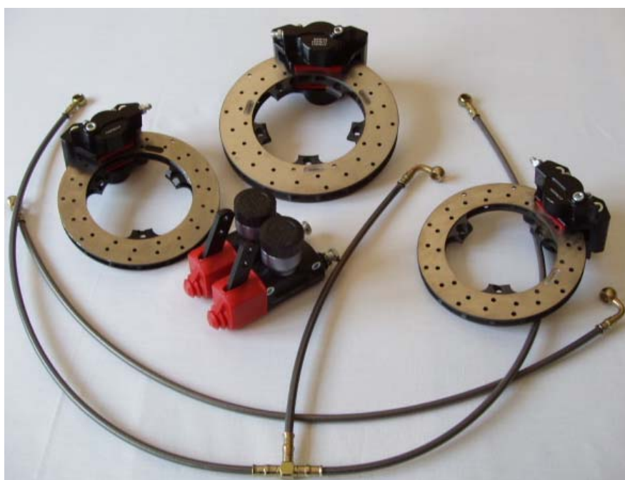
PHOTO VUE DE DESSUS DU SYSTÈME COMPLET ASSEMBLÉ

This Homologation Form reproduces descriptions, illustrations and dimensions of the brake system at the moment of the CIK-FIA homologation. The Manufacturer may modify them, but only within the limits set by the CIK-FIA Regulations in force.