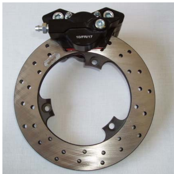
Photo du frein avant : étriers et disques seulement Photo of front brake: calipers and discs only