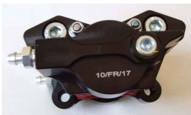
Etriers (Avant) / Calipers (Front)