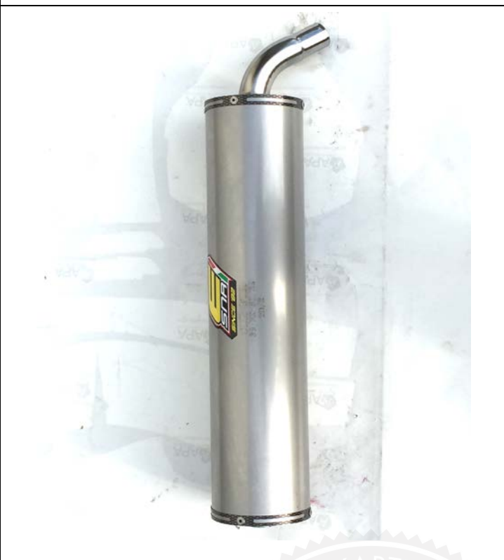
PHOTO DE CÔTÉ PHOTO OF THE SIDE

Signature et tampon de la CIK-FIA Signature and stamp of the CIK-FIA