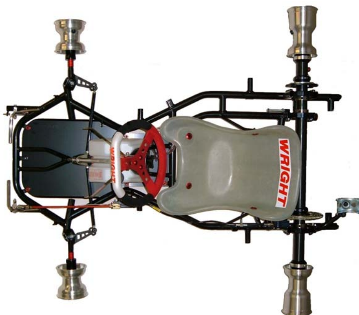
PHOTO VUE DE DESSUS DU CHÂSSIS COMPLET IDENTIQUE À L'UN DES MODÈLES PRÉSENTÉS À L'HOMOLOGATION SANS PARE-CHOC, CARROSSERIE NI PNEUMATIQUES

This Homologation Form reproduces descriptions, illustrations and dimensions of the chassis frame at the moment of the CIK-FIA homologation. The Manufacturer may modify them, but only within the limits set by the CIK-FIA Regulations in force.