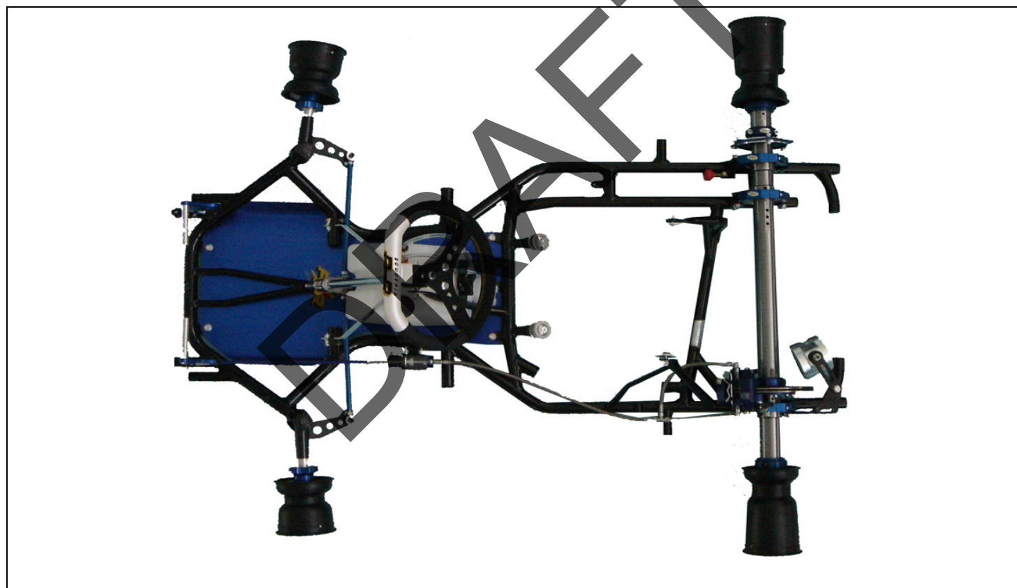
PHOTO VUE DE DESSUS DU CHÂSSIS COMPLET IDENTIQUE À L'UN DES MODÈLES PRÉSENTÉS À L'HOMOLOGATION SANS PARE-CHOCS, CARROSSERIE, SIEGE, NI PNEUMATIQUES

PHOTO FROM ABOVE OF COMPLETE CHASSIS IDENTICAL TO ONE OF THE MODELS SUBMITTED FOR HOMOLOGATION WITHOUT BUMPERS, BODYWORK, SEAT OR TYRES