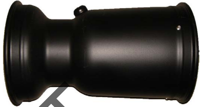
PHOTO DE LA JANTE AVANT POUR PLUIE