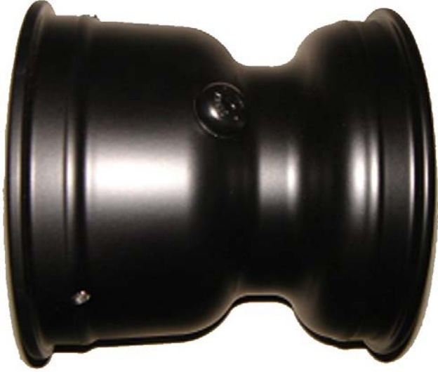
PHOTO OF THE REAR RIM FOR SLICK TYRES