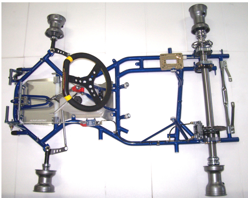
PHOTO VUE DE DESSUS DU CHÂSSIS COMPLET IDENTIQUE À L'UN DES MODÈLES PRÉSENTÉS À L'HOMOLOGATION SANS PARE-CHOCS, CARROSSERIE, SIEGE, NI PNEUMATIQUES

This Homologation Form reproduces descriptions, illustrations and dimensions of the chassis frame at the moment of the CIK-FIA homologation. The Manufacturer may modify them by Extension, but only within the limits set by the CIK-FIA Regulations in force.