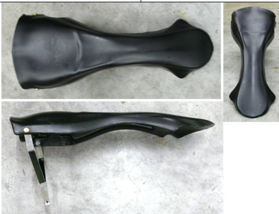
PHOTOS VUE DE DEVANT, DE DESSUS ET DE COTÉ, DU PANNEAU FRONTAL ET SUPPORTS PHOTO FROM FRONT, ABOVE AND SIDE OF FRONT PANEL WITH SUPPORTS

This Homologation Form reproduces descriptions, illustrations and dimensions at the moment of the CIK-FIA homologation.