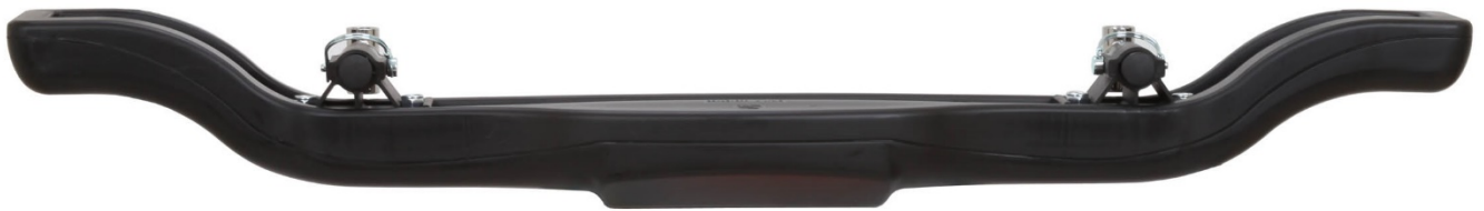
Photo vue de côté avec supports / Photo from the side with supports