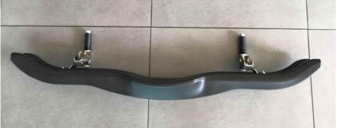
Photo vue de côté avec supports / Photo from the side with supports