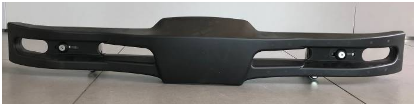
Photo vue arrière de la protection avec supports / Photo of the rear of the protection with supports

Signature et tampon de l'ASN / Signature and stamp of the ASN