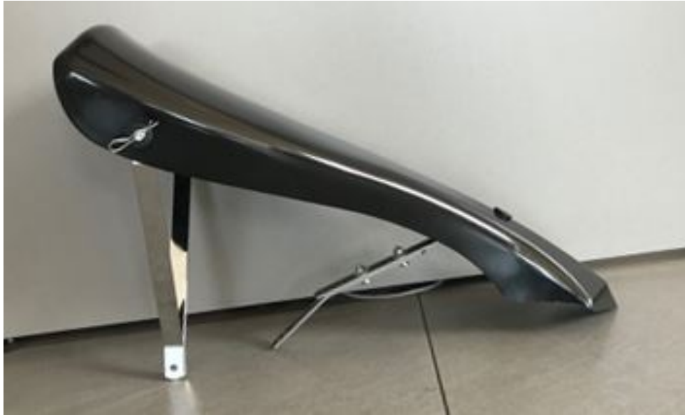
Photo vue arrière avec supports / Photo from the rear with supports