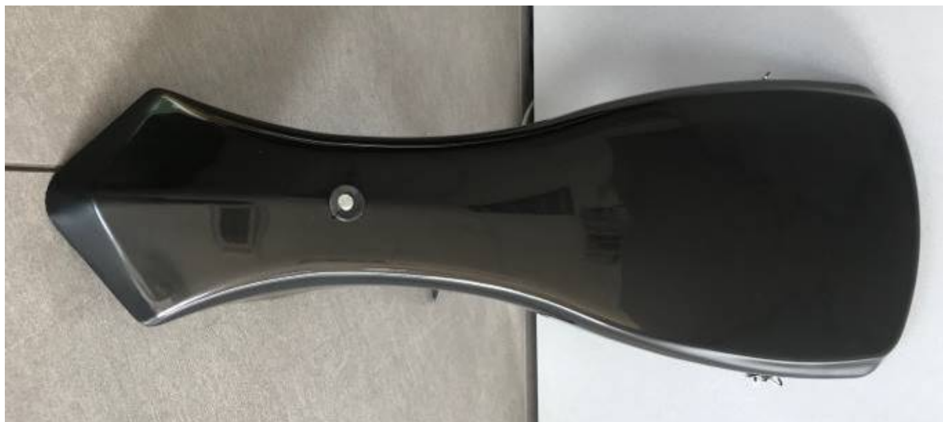
Photo vue de devant du panneau / Photo of the front of panel

Signature et tampon de l'ASN / Signature and stamp of the ASN