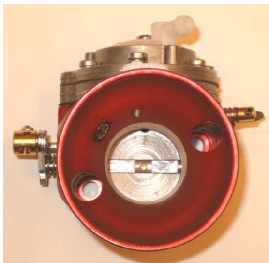
PHOTO CÔTÉ ASPIRATION PHOTO OF INLET SIDE

This Homologation Form reproduces descriptions, illustrations and dimensions of the carburettor at the moment of the CIK-FIA homologation. The Manufacturer may modify them, but only within the limits fixed by the CIK-FIA regulations in force.