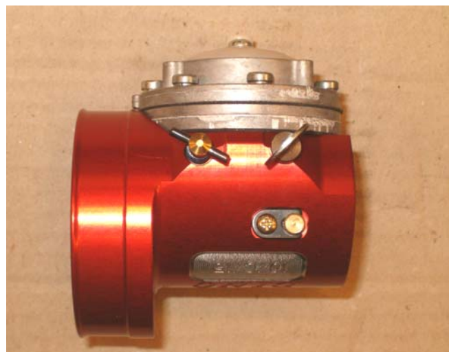
PHOTO CÔTÉ RÉGLAGE PHOTO OF ADJUSTING SIDE

Signature et tampon de l'ASN Signature and stamp of the ASN