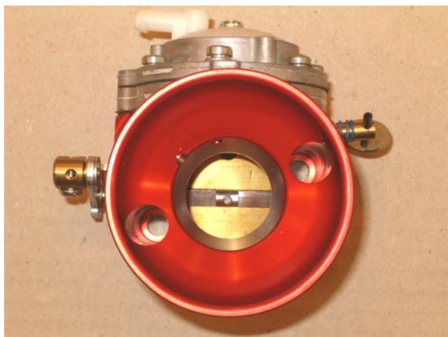
PHOTO CÔTÉ ASPIRATION PHOTO OF INLET SIDE

This Homologation Form reproduces descriptions, illustrations and dimensions of the carburettor at the moment of the CIK-FIA homologation. The Manufacturer may modify them, but only within the limits fixed by the CIK-FIA regulations in force.