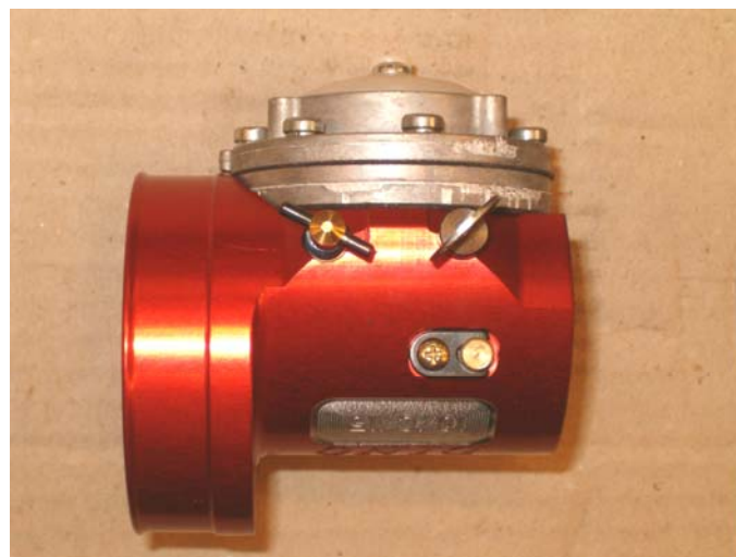
PHOTO CÔTÉ RÉGLAGE PHOTO OF ADJUSTING SIDE

Signature et tampon de l'ASN Signature and stamp of the ASN