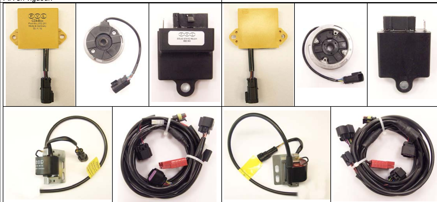
PHOTO de l'ensemble boîtier électronique, rotor + stator, relais, bobine et cablage complet

This Homologation Form reproduces descriptions, illustrations and dimensions of the ignition at the moment of the CIK-FIA homologation. The Manufacturer may modify them, but only within the limits fixed by the CIK-FIA regulations in force.